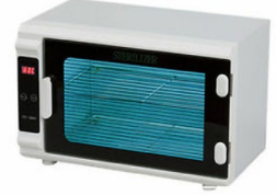
Equipo de esterilización por calor seco