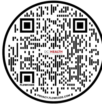
Recursos de DC Health